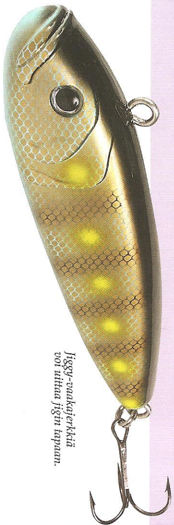
Jiggy-vaakajerkkiä voi uittaa jigin tapaan.