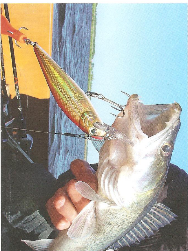
Kookkain SwimTail kelpua hauen ohella myös kuhalle.